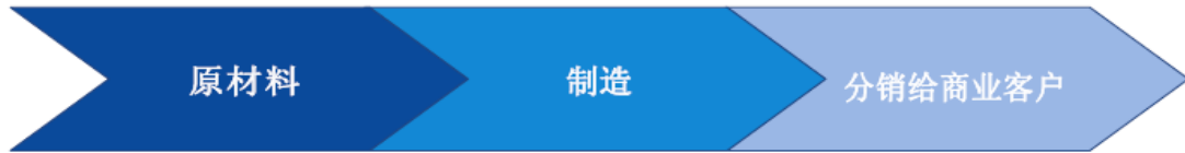
“从商业-到-商业”的商品步骤过程图